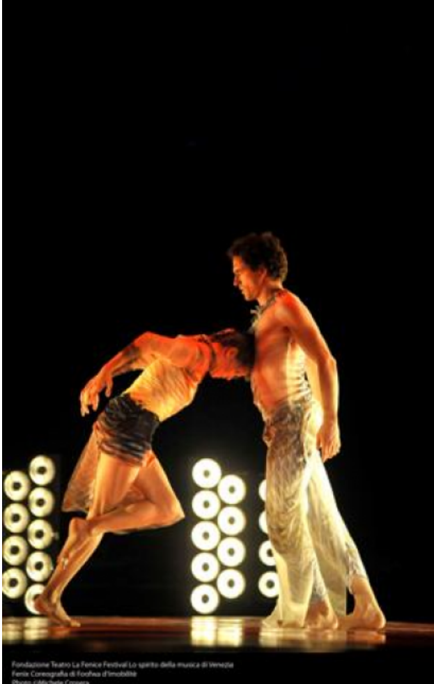
Fondazione Teatro La Fenice Festival Lo Spirito della Musica di Venezia Fenix Coreografia di Foofwa d'Imobilité Musica di Antoine Lengua